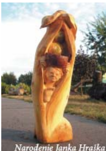
Narodenie Janka Hraška