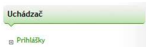
Obr. č. 2: Prihlášky

Po uložení osobných údajov kliknite na „Prihlášky“ v menu „Uchádzač“ (obr. č. 2).