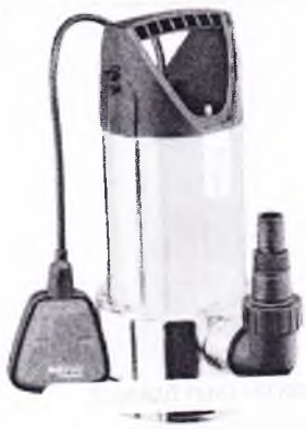
GUDE GS 1101 PI Ponorne kalove cerpadlo